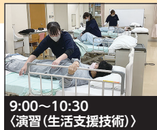
9:00~10:30 〈演習(生活支援技術)〉

利用者の自立に向けた生活を支援するため、入浴・清潔保持・排泄等に関する知識と技術を学ぶ授業です。