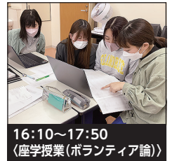
16:10~17:50 〈座学授業(ボランティア論)〉

実践を通して、防災ボランティアに関する理解をより深めるとともに、避難所支援に必要な技術を修得します。