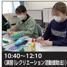
10:40~12:10 〈演習(レクリエーション活動援助法)〉

利用者の自立に向けた生活を支援するため、入浴・清潔保持・排泄等に関する知識と技術を学ぶ授業です。