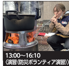
13:00~16:10 〈演習(防災ボランティア演習)〉

実践を通して、防災ボランティアに関する理解をより深めるとともに、避難所支援に必要な技術を修得します。